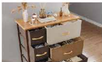
PROTEGE MUEBLES Y ROPA