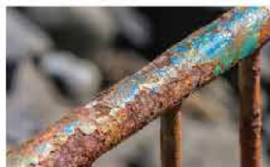
REDUCE OXIDACIÓN Y CORROSIÓN