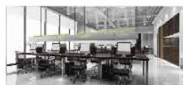
Centros de reuniones y Oficentros