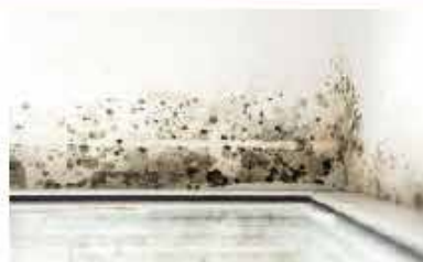
CONTROL DE MOHO