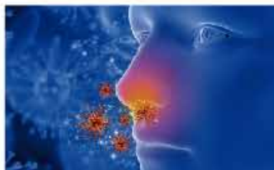
CONTROL DE ALÉRGENOS