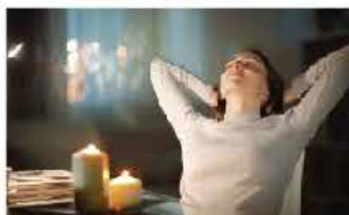
CONTROL DE OLORES